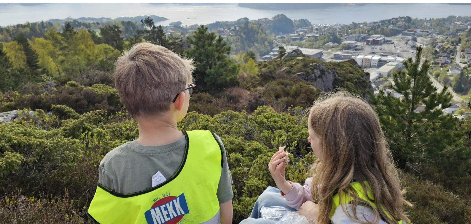
Figur 5 To barn på tur