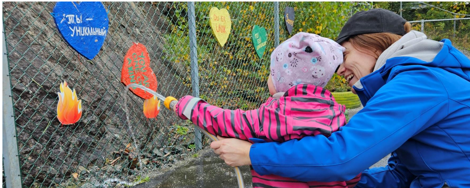
Figur 4 Barn og voksen slukket fiktiv brann

Gjennom vennskap og gode relasjoner skapes et godt grunnlag for læring og utvikling. I barnehagen skal vi legge til rette for at barna kan etablere vennskap. Hvert barn er unikt og barnas opplevelse i møte med andre vil påvirke deres oppfatning av seg selv. Barna skal bli tatt på alvor og møtes med anerkjennelse, tillit og respekt.