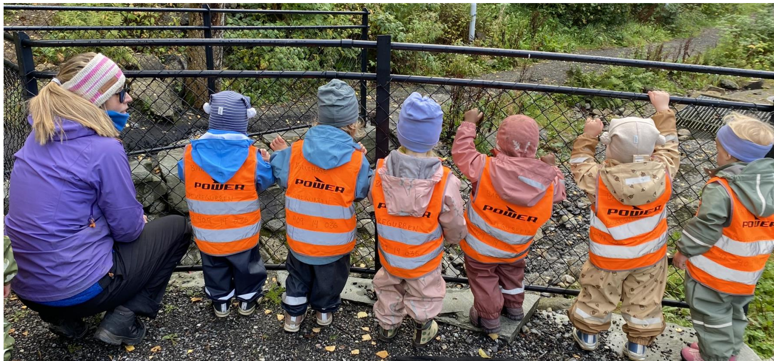
Figur 3 voksen og barn på tur