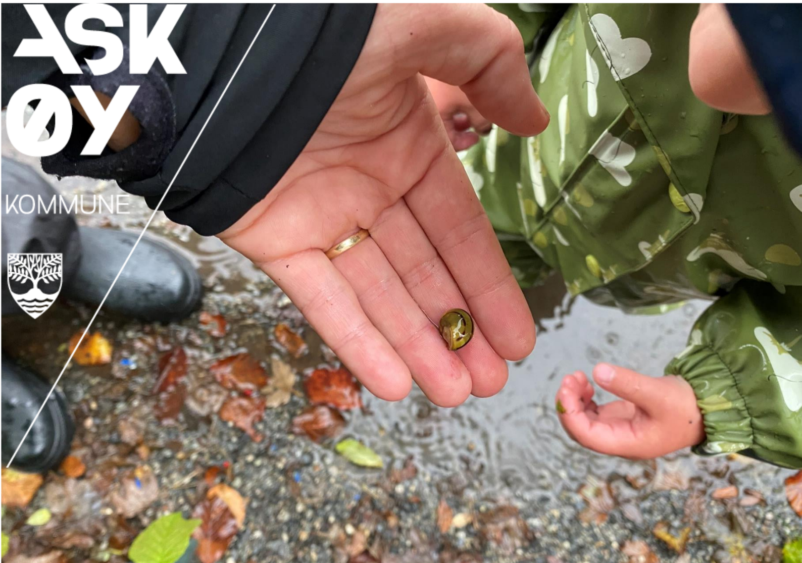
Figur 1 barn leker ute