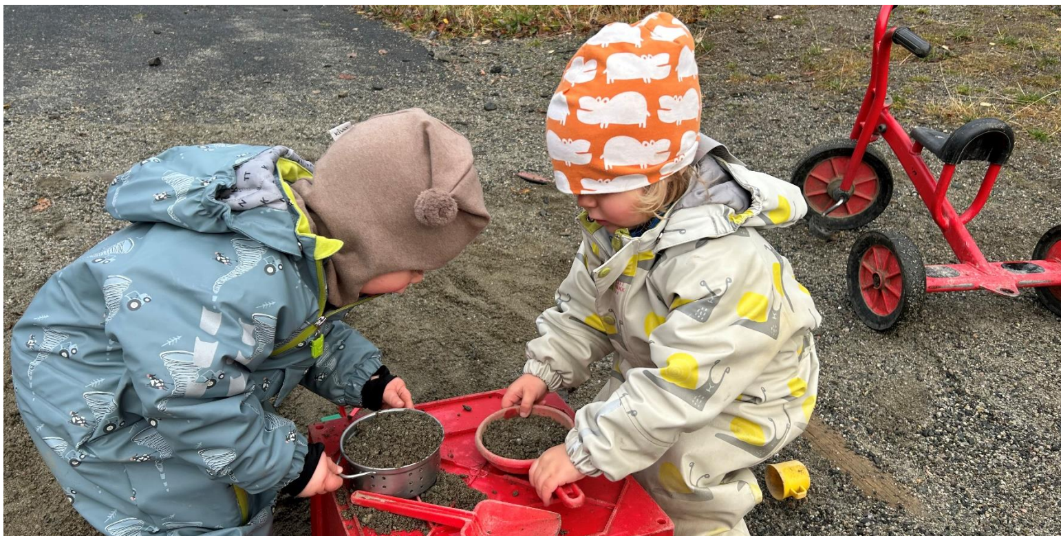
Figur 2 Barn som leker med sand